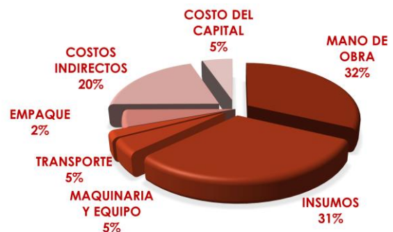
Gráfica 1. Desagregación de Costos de producción (Ha) Criolla - 2018 Cundinamarca