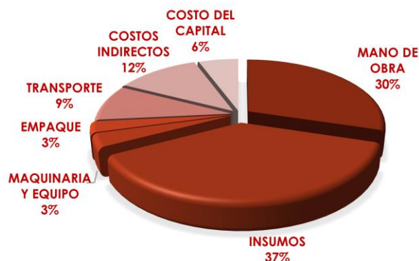
Gráfica 3. Desagregación de Costos de producción (Ha) Superior 2018- Cundinamarca