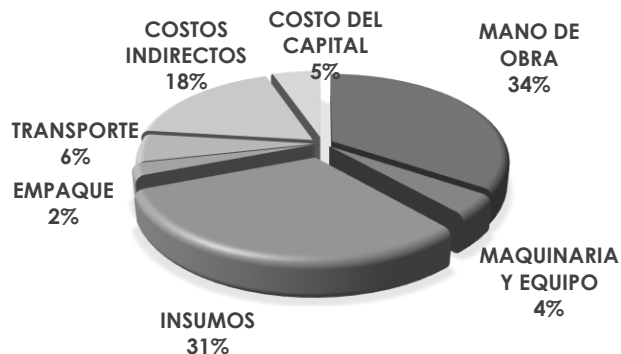
Gráfica 1. Desagregación de Costos de producción (Ha) de papa Criolla – Colombia 2018